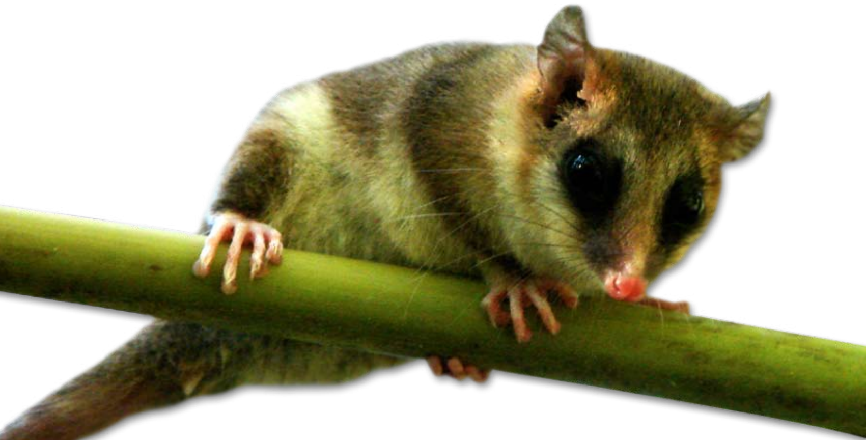
¡LUZ Y CÁMARA! Los investigadores de Bariloche realizan, con radiotransmisores y cámaras de video, un seguimiento del monito, cuyo cuerpo mide en promedio 12 cm de largo, más 11 cm de cola.