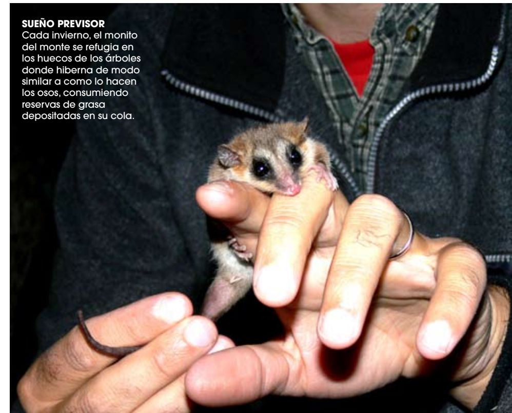
SUEÑO PREVISOR Cada invierno, el monito del monte se refugia en los huecos de los árboles donde hiberna de modo similar a como lo hacen los osos, consumiendo reservas de grasa depositadas en su cola.

de Australia que con el grupo de marsupiales con mayor presencia en América del Sur, que incluye a las comadrejas.